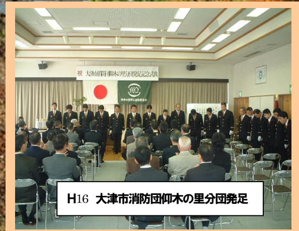
H16 大津市消防団仰木の里分団発足