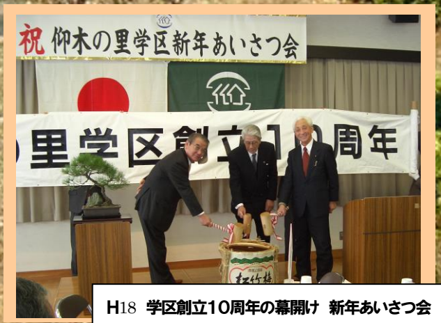
H18 学区創立10周年の幕開け 新年あいさつ会