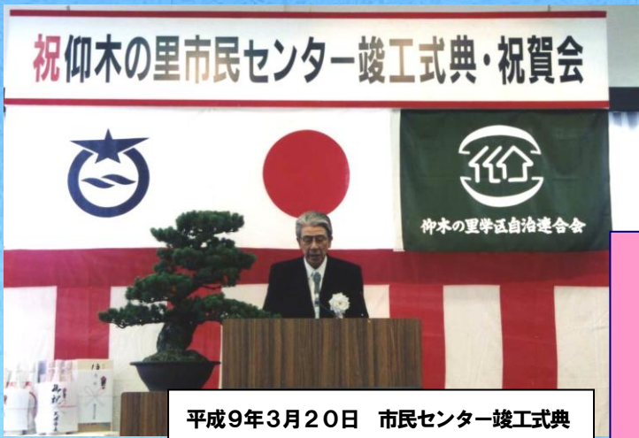
平成9年3月20日 市民センター竣工式典