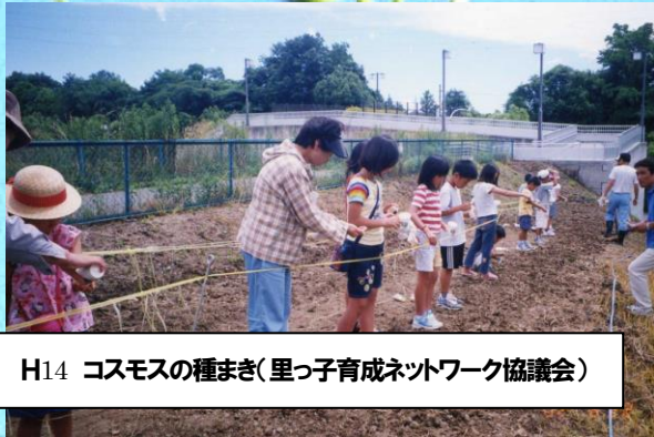
H14 コスモスの種まき(里っ子育てネットワーク協議会)