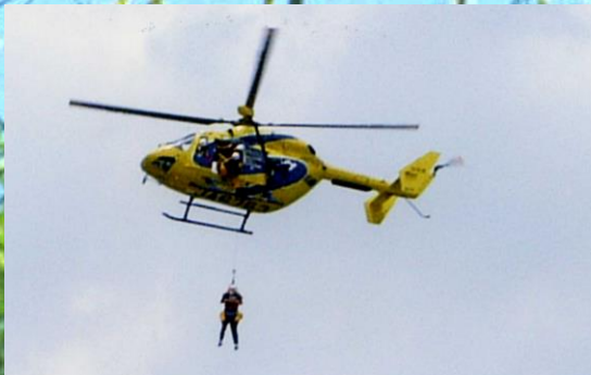
H14 大津市総合防災訓練(仰木の里小学校)