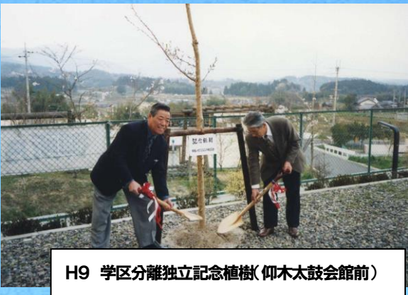
H9 学区分離独立記念植樹(仰木太鼓会館前)