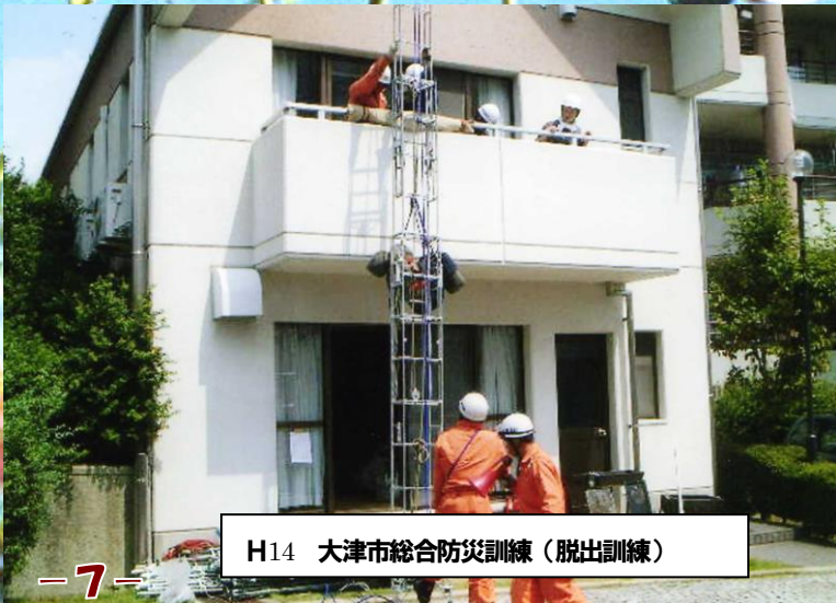
H14 大津市総合防災訓練(脱出訓練)