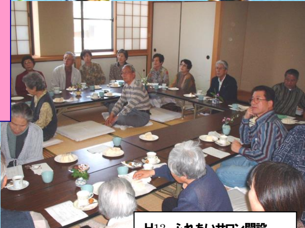
H13 ふれあいサロン開設