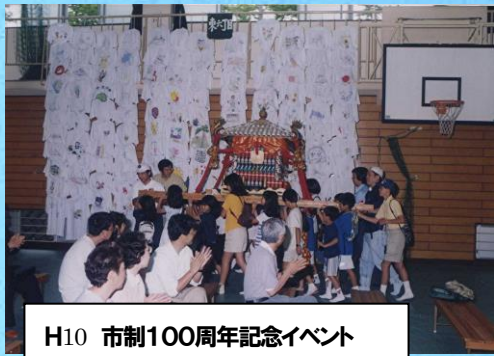
H10 市制100周年記念イベント