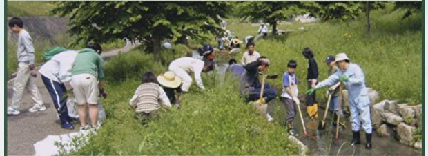
★仰木の里学区自治連合会 おおぎのさとがっくじれんごうかい 滋賀県大津市

レークピア大津・仰木の里は、昭和61年4月の街開き以来、都市下水路を複断面とし、せせらぎとして整備された御呂戸川緑地の約700mの清掃管理が行き届かず、ヘドロやゴミ、水草が繁茂し当初の親水空間から程遠く最も環境の悪い区域になっておりました。「地域の環境を見つめよう」をテーマに、仰木の里小学校5年生の「御呂戸川調査」に始まり、その結果を見た子供達の「汚れた川を自分達の手できれいにしよう!」との発案によって、中学、高校、老人会と地域住民とが取り組む一斉清掃活動へと発展しました。毎回、100名程の参加者が川に入り、草の根掘りや重い汚泥に手を突っ込み泥だらけになりながらも子供達の笑い声の絶えない清掃活動になっており、水面さえ見ることが出来なかった水路が蘇ろうとしております。又、街路樹の剪定等も実践されており今後益々活動の広がりが期待できる団体であります。