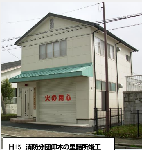
H15 消防分団仰木の里詰所竣工