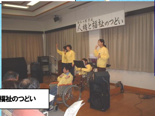
H12 人権と福祉のつどい