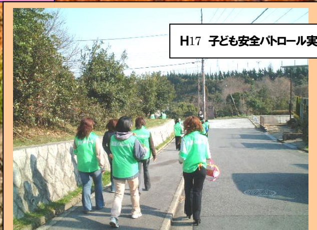
H17 子ども安全パトロール実施