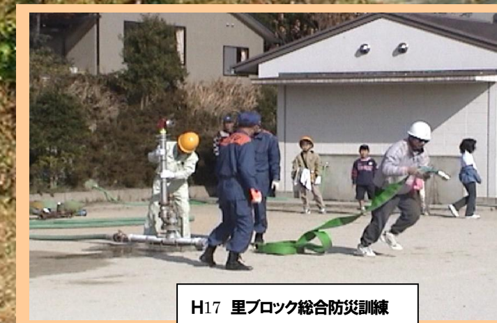
H17 里ブロック総合防災訓練