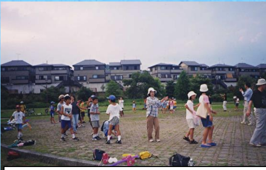
H11 第1回子どもフェスタ開催(御呂戸川緑地公園)