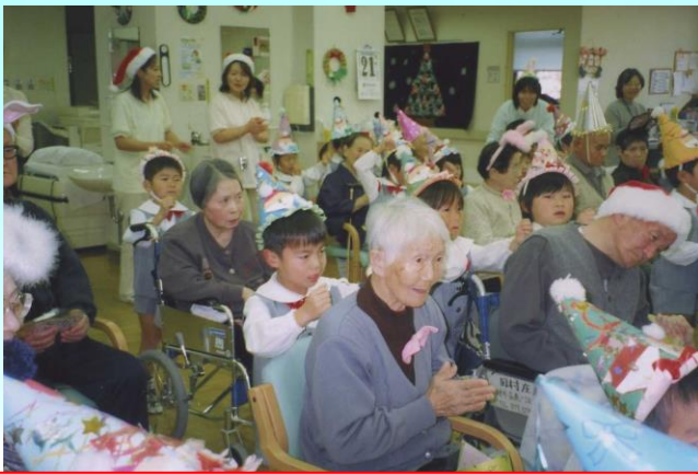
アクティバ ケアセンターの訪問 4歳児が訪問しておじいさん・おばあさんと楽しくふれあいました