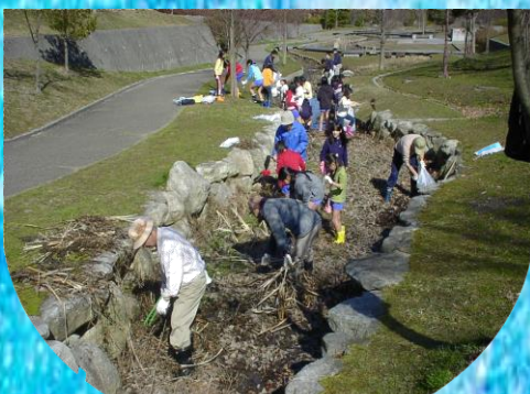
御呂戸川の清掃 (きれいになりました)