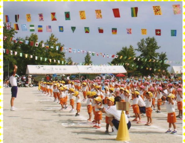
“みんなで楽しむ運動会” (於：仰木西公園) 手足をいっぱい伸ばして準備体操 広いグラウンドで思いっきり体を動かします。

躰と音体教育を柱として 子どもに社会性が身につく保育をしています。 隣接する仰木西公園から四季折々の自然の恵みを受けて 乳幼児が心身ともに健やかに育っています。 花や動物、水・山・食べ物などを毎月の保育テーマに 取り入れて、年齢に応じた歌や制作などを行っています。