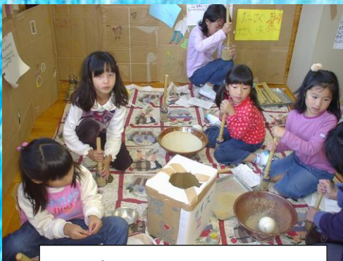
あっぱれ祭 (脱穀、精米の研究)