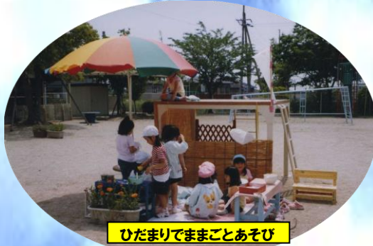
ひだまりでまごことあそび