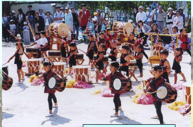
運動会での和太鼓の演奏 子どもも親も真剣です (4歳児)