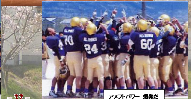
アメフトバワー 爆発だ