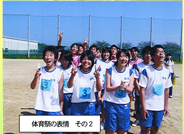
体育祭の表情 その2