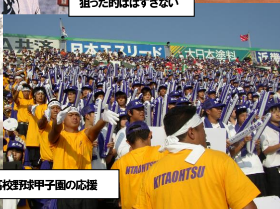
高校野球甲子園の応援