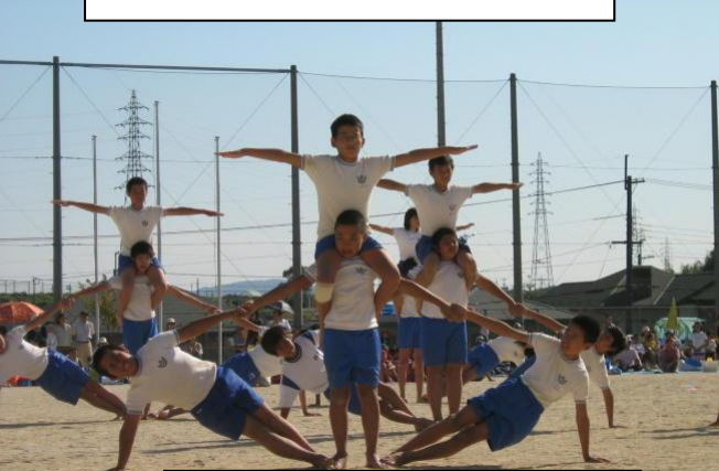
6年生、最後の運動会の組体操です。