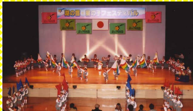
“星の子フェスティバル” (於：大津市北部地域文化センター) 0歳児～5歳児の全園児が、 音体教育に取り組む様子を発表しています。