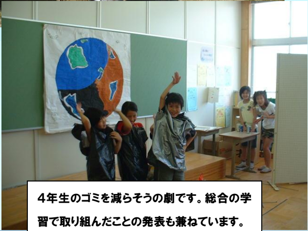
4年生のゴミを減らそうの劇です。総合の学習で取り組んだことの発表も兼ねています。