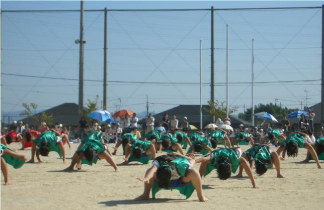
5年生のロックソーラン節です。力強い演技のポーズです。