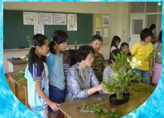
室町文化体験学習(生け花)