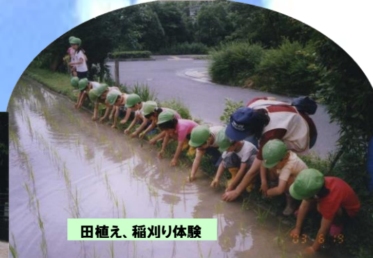
田植え、稲刈り体験