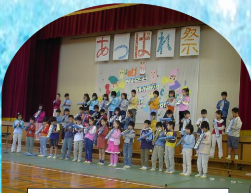
あっぱれ祭 (ただいま演奏中)