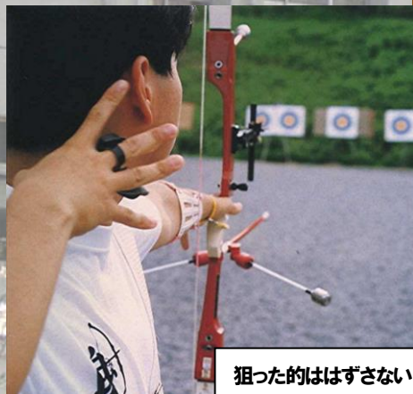
狙った的はずさない