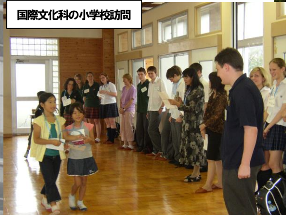
国際文化科の小学校訪問

本校では、以上のような教育活動を通して、生徒の自己理解を深め、生徒自らが個性を発揮できる機会を与えることによって、調和のとれた個性豊かな人間の育成を目指しています。