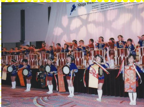
“世界水フォーラム” レセプション (2003. 3 於：大津プリンスホテル)

滋賀県と大津市の要請により、和太鼓演奏と英語で挨拶 世界湖沼会議、アジア太平洋障害者の10年、全国母子保健 大会、大津市制97周年・100周年記念式などにも、 マーチングや和太鼓の演奏・演技で出場しました。