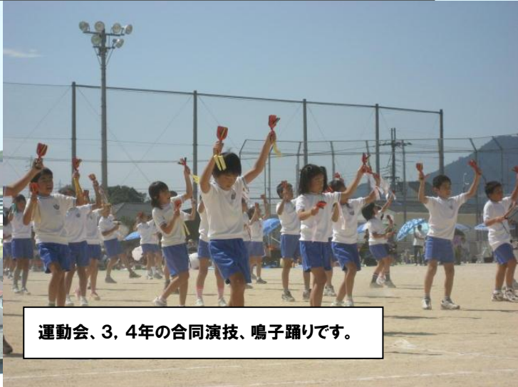
運動会、3, 4年の合同演技、鳴子踊りです。