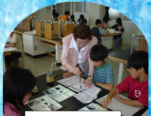
室町文化体験学習(水墨画)

昭和50年代から開発され、昭和61年から入居が始まった大規模新興住宅地で、計画的によく整備され、西に比叡の山並み、東に琵琶湖を望み、風光明媚で落ち着いた教育環境の丘陵にたつ学校であります。開校以来、「生命・自立・支えあい」を学校教育目標に掲げ、「元気いっぱいの子ども、やる気いっぱいの子ども、思いやりいっぱいの子ども」を目指しています。中でも「思いやりいっぱいの子ども」を最重点課題に、人や自然とのかかわりを大切にした体験的活動や道徳教育に力を入れています。