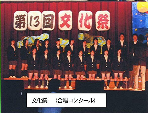
文化祭（合唱コンクール）