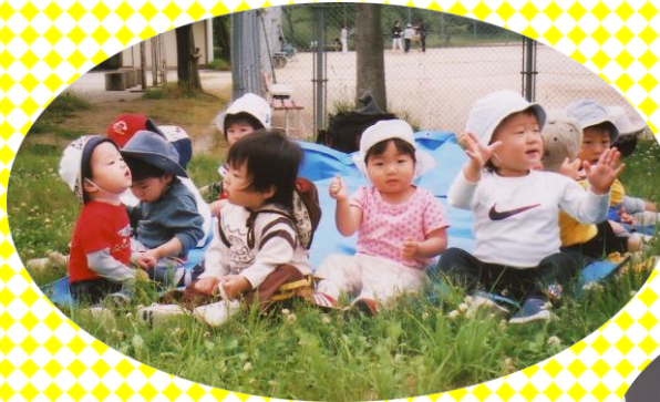
“1歳児のお散歩” 仰木の里内のあちこちの公園に出かけて、 自然と友だちになります。だんだん 長い距離も歩けるようになってきます。