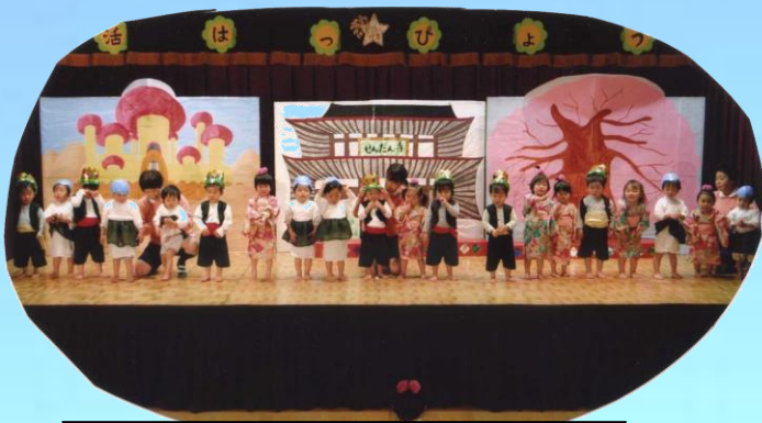
1歳児の生活発表会 職員手作りのかわいい衣装を着てお遊戯をしました