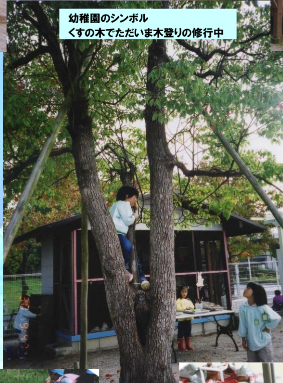
幼稚園のシンボル くすの木でただいま木登りの修行中