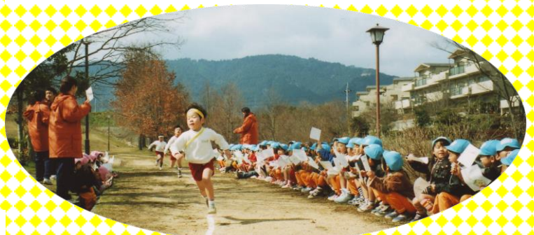
“マラソン・駅伝大会”

滋賀県と大津市の要請により、和太鼓演奏と英語で挨拶 世界湖沼会議、アジア太平洋障害者の10年、全国母子保健 大会、大津市制97周年・100周年記念式などにも、 マーチングや和太鼓の演奏・演技で出場しました。