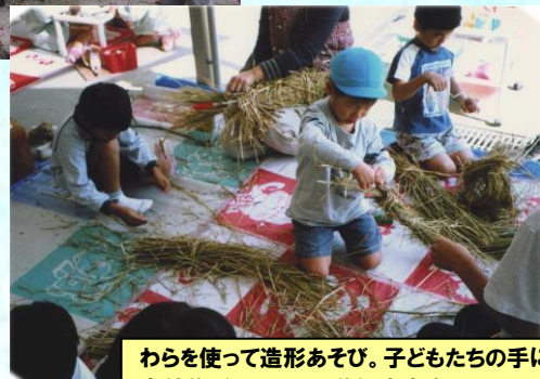
わらを使って造形あそび。子どもたちの手にかかる 自然物がいろいろな物に大変身!!