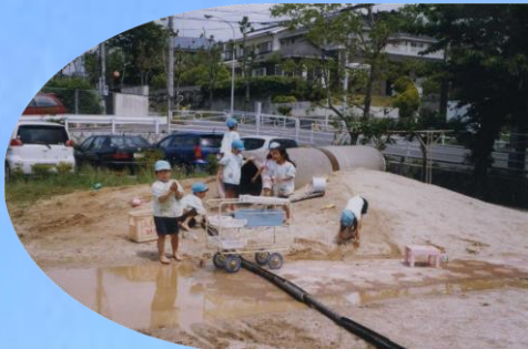
砂と水でダイナミックなあそび