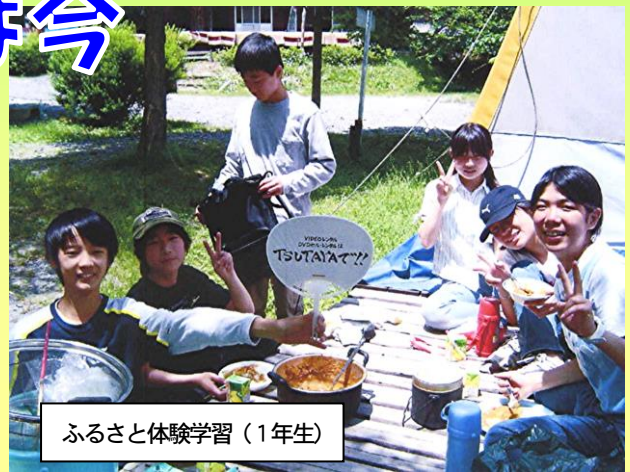
ふるさと体験学習（1年生）