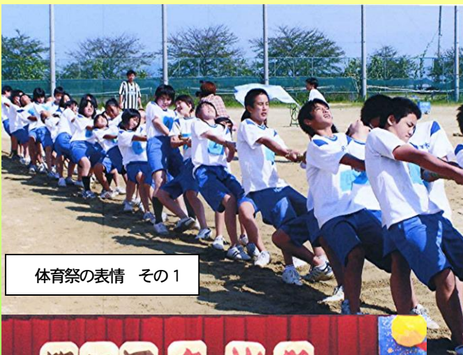
体育祭の表情 その1