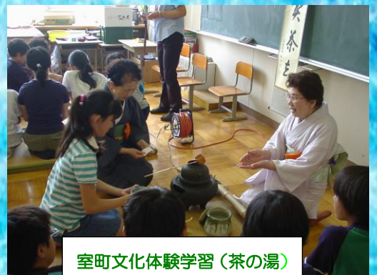
室町文化体験学習(茶の湯)