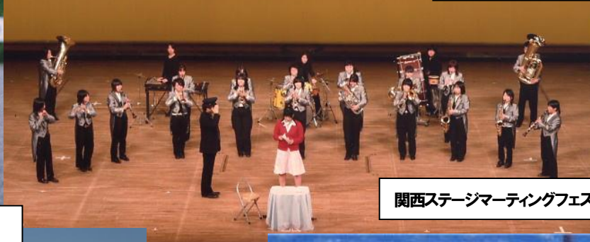
関西ステージマーチングフェスティバル