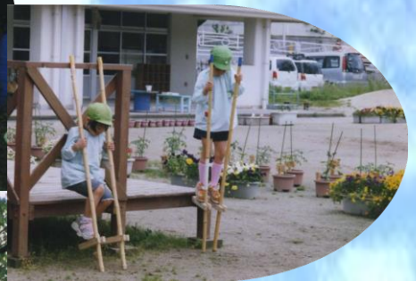
親子で作った竹馬、「のれるよー」