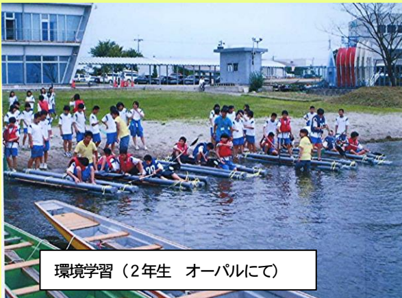
環境学習（2年生 オーパルにて）