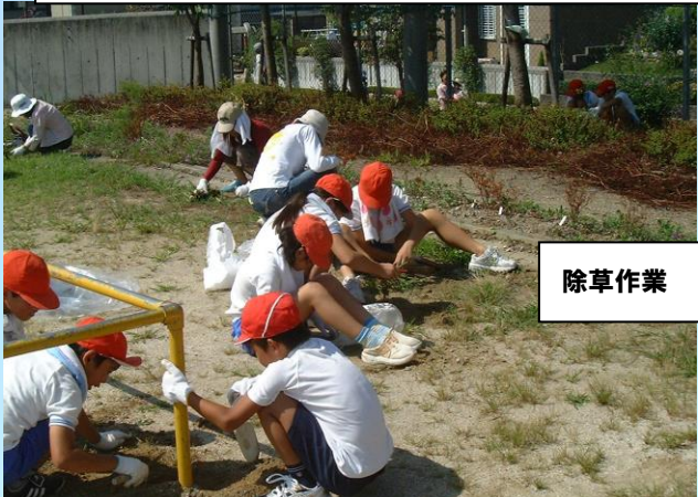
除草作業 私達の学校は私達の手で