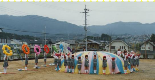
平成4年4月 開園を祝って、園庭で マーチングドリルを発表し 保育が始まりました。 今年で15年になります。