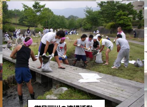
御呂戸川の清掃活動