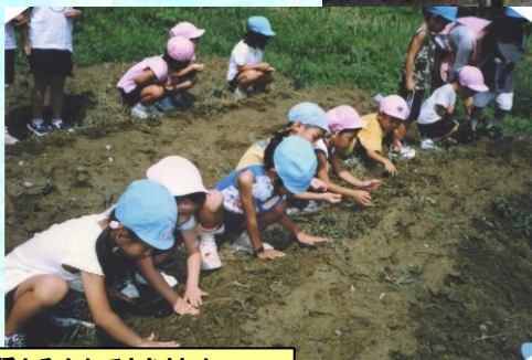
大根の種をみんなでまきました。 どんな大根ができるか楽しみです